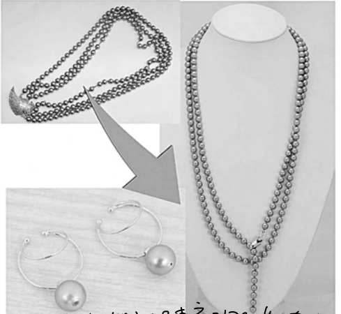
34723 古いダイヤリングを3層ダイヤ リングにリファムさせていただきます