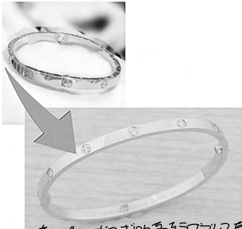
34684 古いダイヤリングのダイヤをラファエル 修理させていただきます。