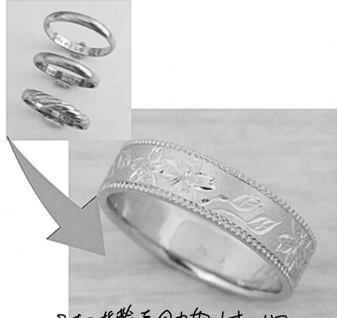
34424 3本の指輪を分けて1本にリファ ムさせていただきます。