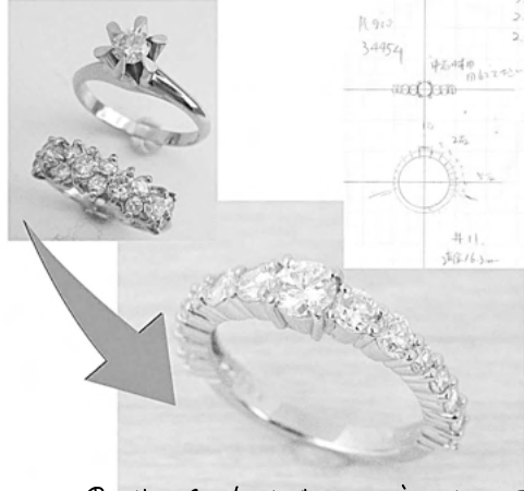
34454 思い出の古いダイヤリングを 新しいダイヤリングのようにリフォーム させていただきます