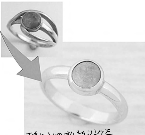
34495 お客様の古いダイヤリングを ミニマルなダイヤリングにリフォームさせていただきます