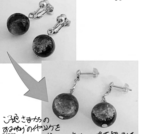
ご来店のお客様の おまけのダイヤリング 34878 ビーズにリファム させていただきます