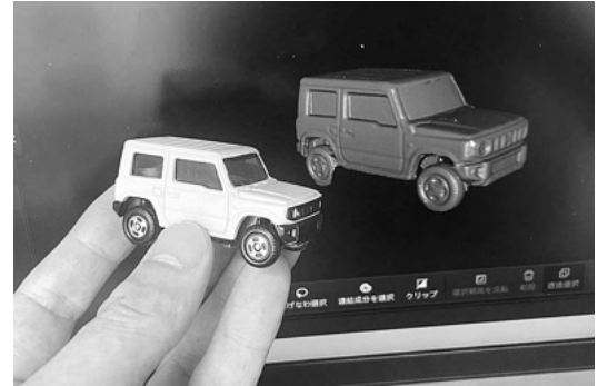
ミニカーをスキャン！！