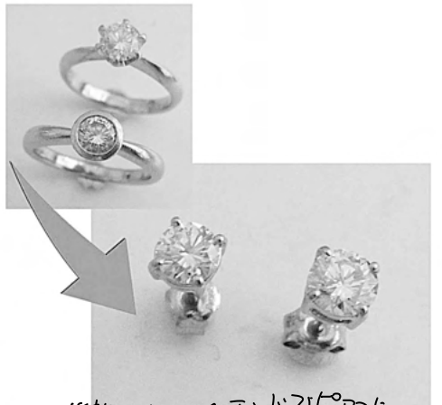
34784 指輪2本のダイヤをビーズに リフォームさせていただきます