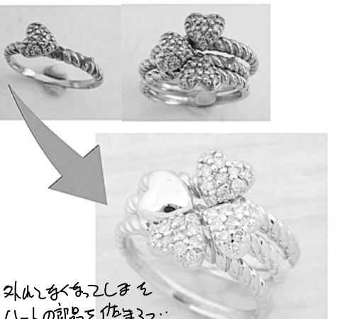
外山と内山を分けて ハートの部分を制作 34680 新品のダイヤにリファム させていただきます