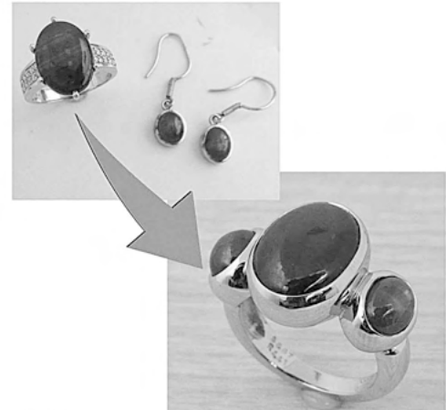
34357 外国旅行の思い出のダイヤアパレル を分けて指輪にリフォームさせていただきます