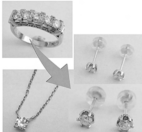
34705,34712,34713 古い指輪から5石ダイヤリングを7石ダイヤまで ビーズにリフォームさせていただきます