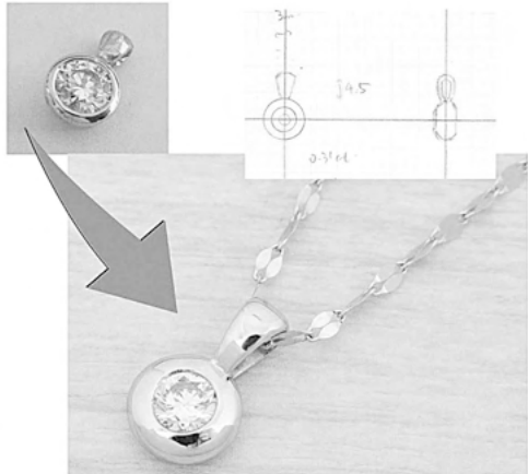
34640 お客様のテカイトへのダントト リフォームさせていただきます。