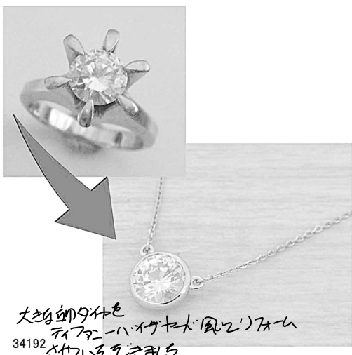
大きな卸ダイヤを ティファニーハイクワスタイルに 34192 'リフォームとせいでいをきましょ。