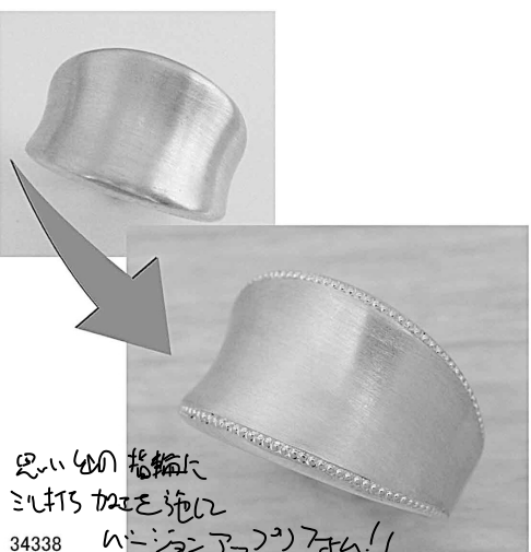
思い出の指輪に ミルキス加工を施して 34338 ハイクワスタイルに リフォーム!