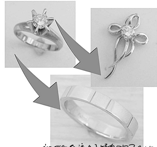
34155, 34156 卸ダイヤを流れるようなワウスタイルの にリフォーム 残りのワウスタイル指輪の リフォームとせいでいをきましょ。