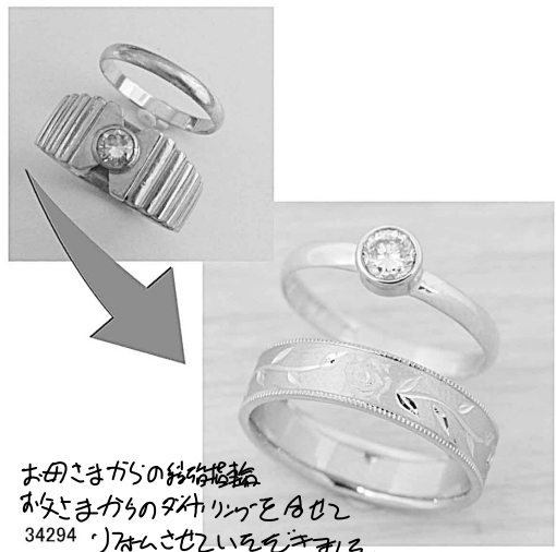
お母さまからの結婚指輪 お父さまからのタカシリングを月夜 34294 'リフォームとせいでいをきましょ。