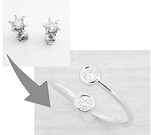
34125 タンクヤスとまき子・ティファニーのよう なデザインにリフォームとせいでいをきましょ。