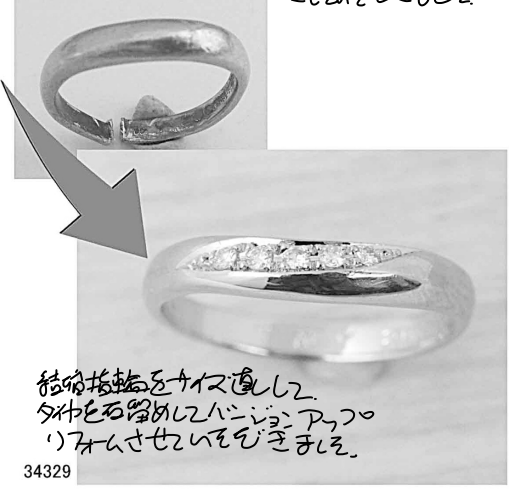
結婚指輪をサイズ直し タカシを留めたいにデザイン 34329 'リフォームとせいでいをきましょ。