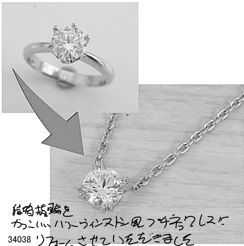
結婚指輪を かっこいいハイクワスタイルに 34038 'リフォームとせいでいをきましょ。