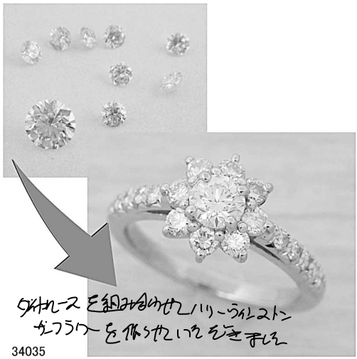
タカシとタカシを組み合わせたハイクワスタイル 34035 'リフォームとせいでいをきましょ。