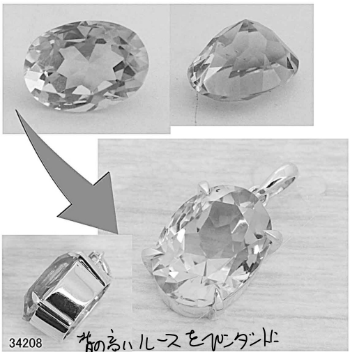
34208 昔の古いルースをハイクワ 'リフォームとせいでいをきましょ 4