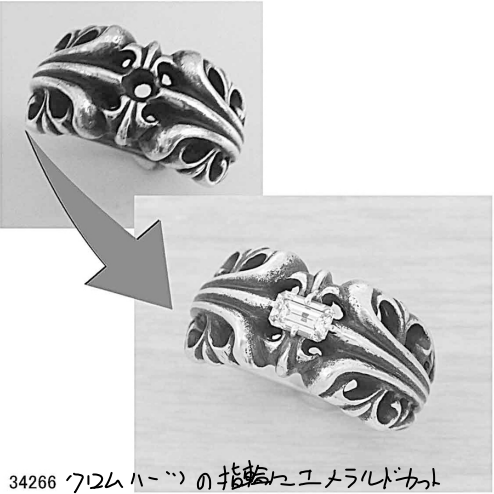
34266 フロムハーツの指輪とユメラバカハク 9件をカスミとせいでいをきましょ。