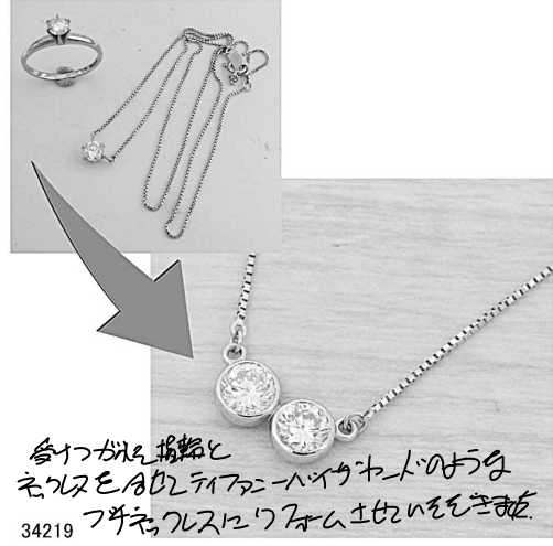
各ワウスタイル指輪と タカシを月夜にティファニーハイクワ 34219 フチワウスタイルにリフォームとせいでいをきましょ。