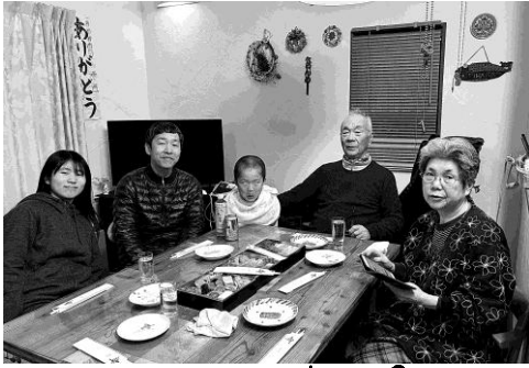
とみあちゃんのお正月。。。