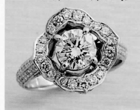
お母様の大切な指輪を修理し直し