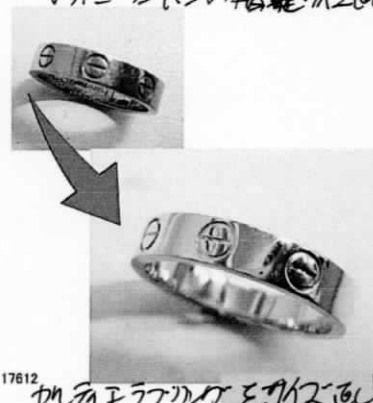
17612 カルティエリングをピアスに直し