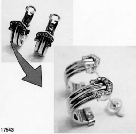
17543 カルティエトリコティエリングをピアスに