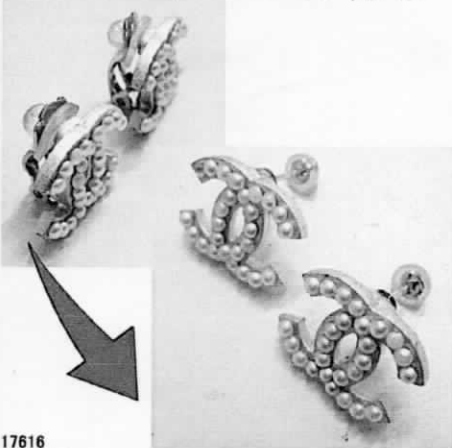
17616 シャネルリングをピアスに