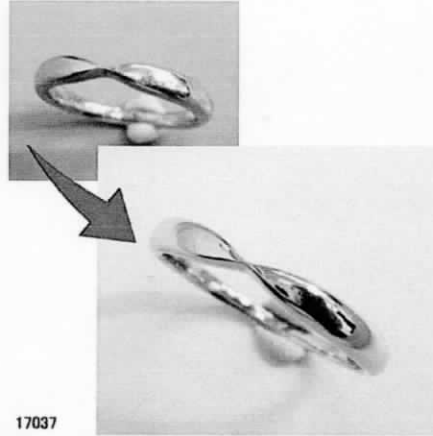
17037 ペティファニーリングをサイズ直し