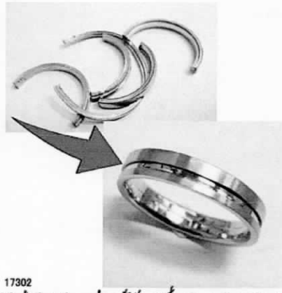
17302 お母さまの大切な時にバラバラになったリングの指輪に直し