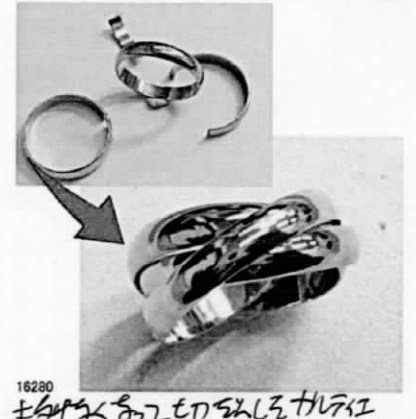
16280 結婚指輪をピアスに直し指輪に