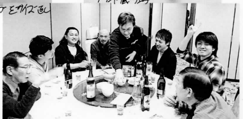
ジュエリー職人の新年会