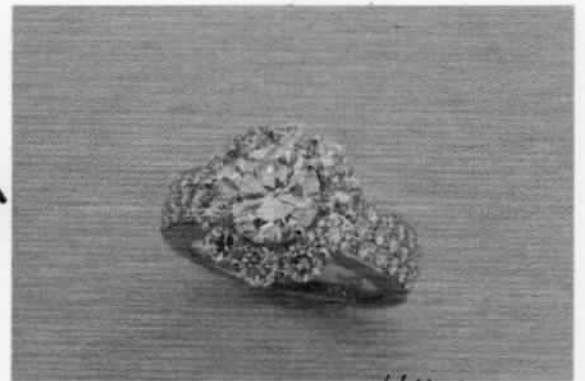
2カラットのダイヤを豪華ジュエリー 16135

手作りジュエリーをお受けするときお客さんは皆さん、「私のしたかったことはそういうことなのよ!!」と笑顔になられます。なかなか、お会いしてお話をお伺いしないことには「お客様の夢を言語化」できません。お客様のジュエリーの叶えたい夢が4つあって4つとも叶えようとする予算が足りません。その夢の優先順位と現実的な予算をすり合わせながら夢を叶えていくのが手作りジュエリーかなと思います。