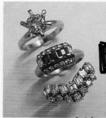
3本の指輪を1本のブライダル