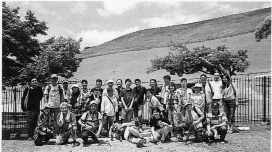
大阪、神戸、奈良のジュエリー職人による「若草山」