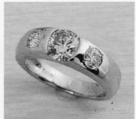
2つのダイヤを、クレスと指輪のリフォーム