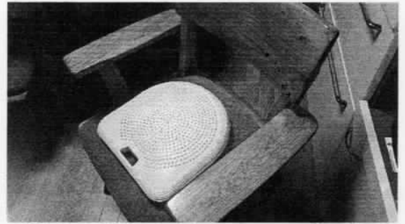
ア腰の角度がよくなっていく座布団

は正せません。ちょっと背をそらして肩を引いて足の上に腰、腰の上に腹、腹の上に胸、胸の上に首を乗せる。そういった肩の力を抜いたいつでもスムーズに動ける状態が姿勢が良いということでしょう。だから、スポーツ選手の体、動きを見ると美しいと感じるのでしょね。