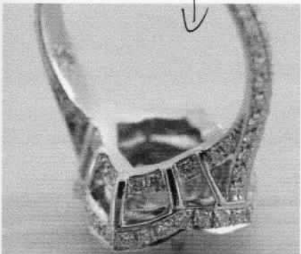
裏までデザインが美しい!! 16218