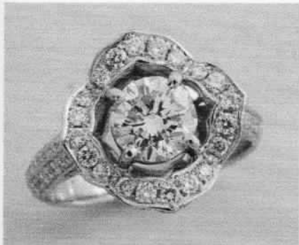
お客様のデザインを再現している様子