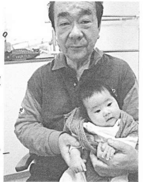
生きたあつこの前月 ちの子であ。