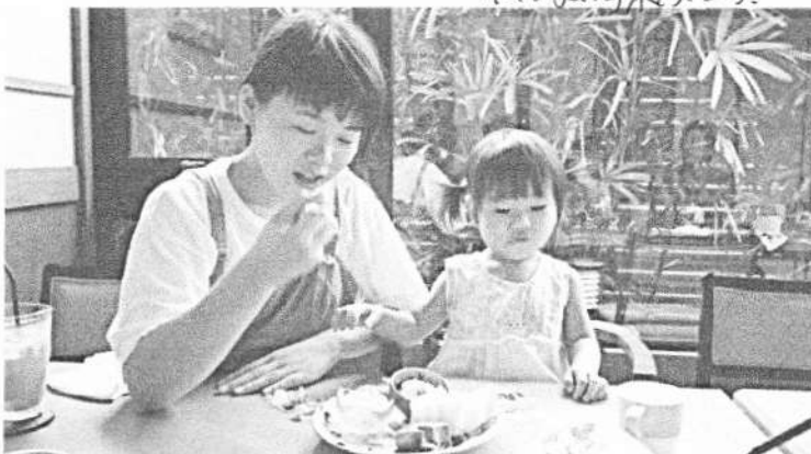
ロイカ、ス、マ、の、 みづきとみづきとみづき