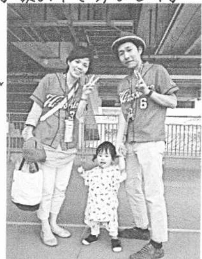
娘 家孫はわっかん!!