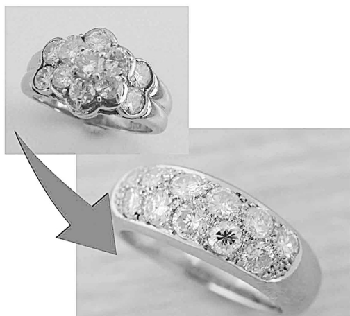
33703 3,400年前のつらつリングを ハーフリングにリファムさせていまして ました。