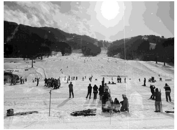
タングラム玫瑰苑のゲレンデ

●激動の時代のスキー場。お世話になったスキー宿も、元旦は8部屋中4部屋が日本人でしたが、帰る頃の1月3日には、 日本人家族は私たち夫婦だけ。あとは訪日外国人ばかりでした。 これにはびっくりしました。宿のご主人も英語をしゃべると脳が疲れる！と嘆いておりました。 ココでもとても大きな時代の変化を感じるお正月でございました。