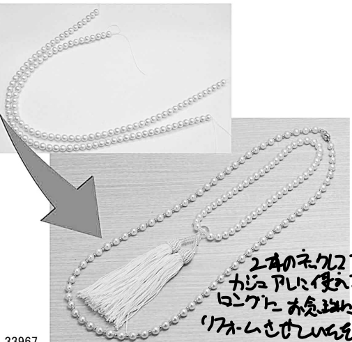
33967 2本のネクラを カジュアに使える ロングに大変 リファムさせています。