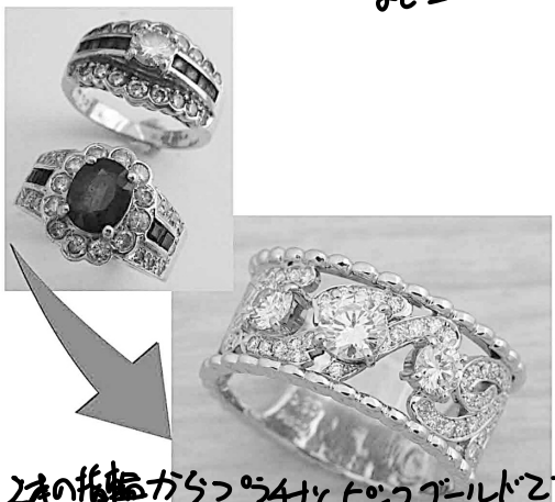
33683 2本の指輪からつらつと500ゴールドで かみくまにリファムさせています。