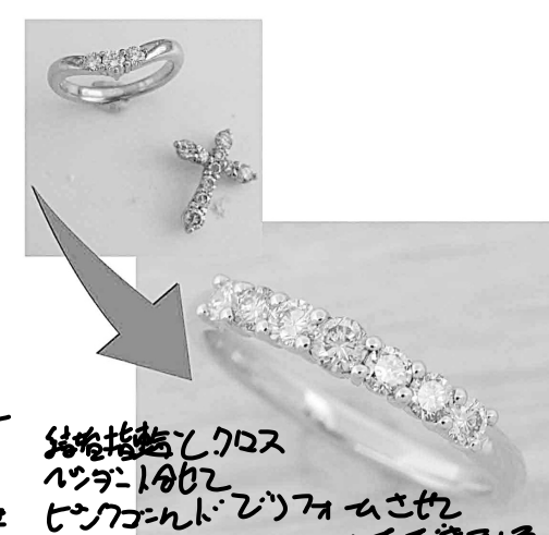
33779 結婚指輪とクロス ペンダントを 500ゴールドでリファムさせ ています。