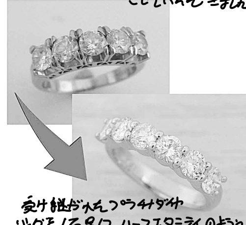
33676 変身紐がねつらつと94 カラットを18金にハーフエタニティのよう にリファムさせています。