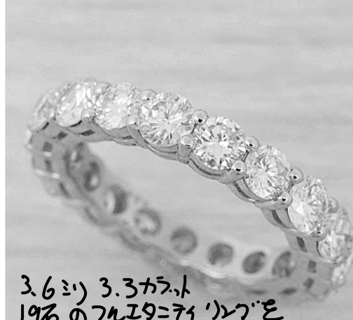
33739 3.6ミリ 3.3カラット 19石のフルエタニティリングを 作らせています。