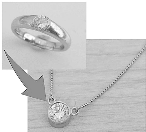
33626 94カラットの18金500ゴールドで ティファニーの様にリファムさせていまして ました。