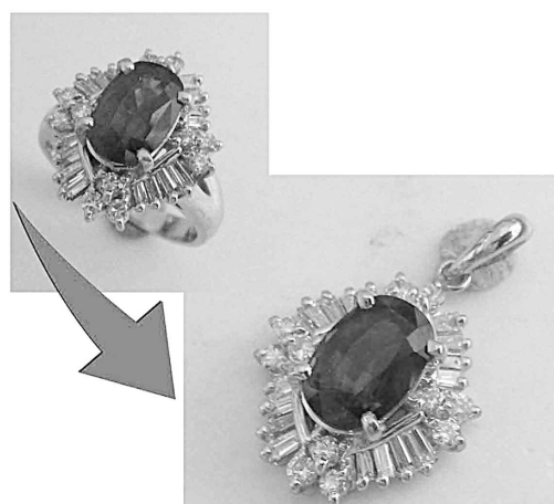
33821 カマヤの指輪をデザインのままに 周りの94カラットを18金にリファム させています。