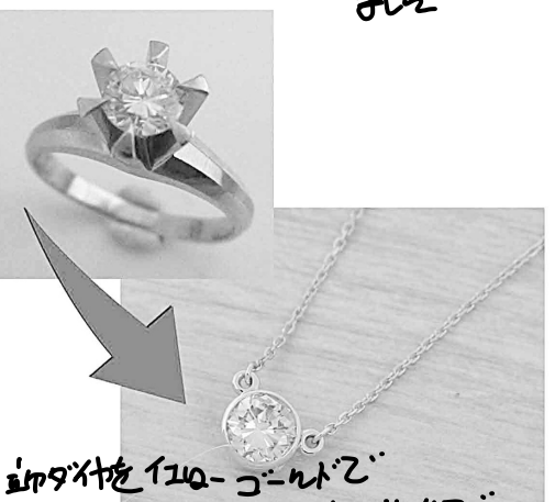
33902 94カラットの18金500ゴールドで ティファニーハーフエタニティデザインに リファムさせています。