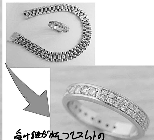
33706 変身紐がねつらつと94 カラットを指輪に入れたフルエタニティ にリファムさせています。