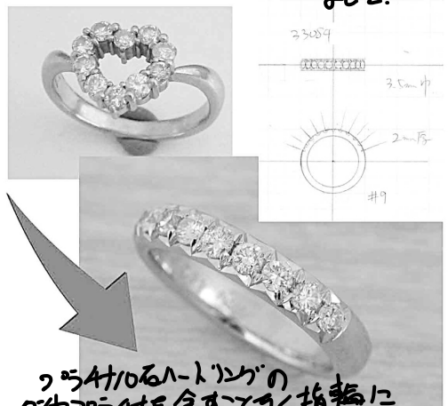
33084 つらつ10石のハートリングの 94カラットを全部とめて指輪に リファムさせています。