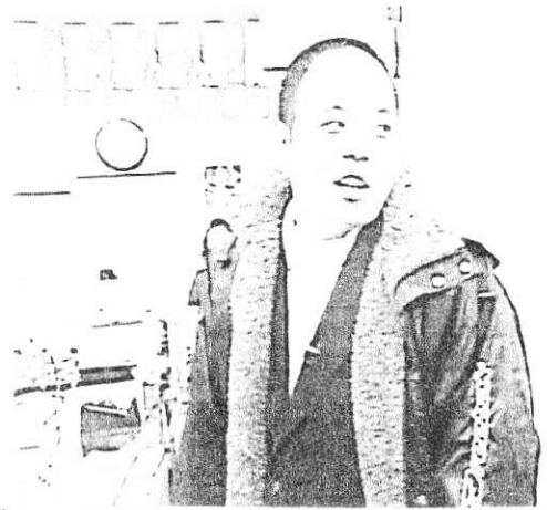
大阪ほんまテレビのホシコシさんです。