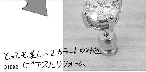
31892 2つモ美しい2カラットダイヤを ヒート処理にリメイク