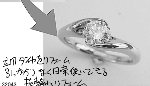
32043 2枚のダイヤをリメイクして 3つに作り直して日常使いできる 指輪