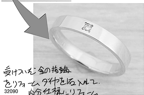
32090 受け入れ金の指輪を リメイクしてダイヤを添え 自分仕様