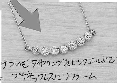
31871 3枚のダイヤリングをピアスにリメイク フォンテーブリスにリメイク