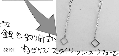
32191 ヒール 銀色釣針式 おしゃれなピアスにリメイク