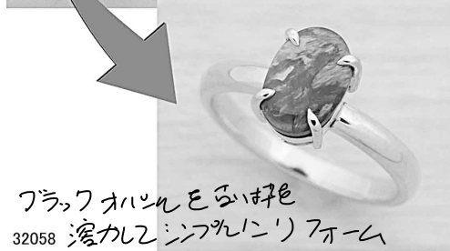
32058 フラワーオパールを白く染めて リメイク