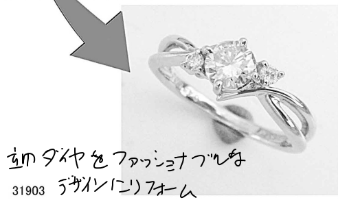
31903 2枚のダイヤをファッションリングに リメイク