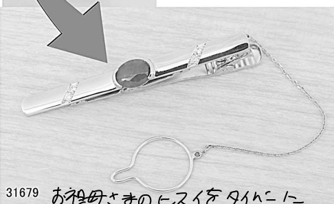
31679 お祖母さまのヒスイをダイヤモンド にリメイク