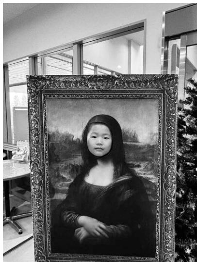
モナリサなヒナタ君。