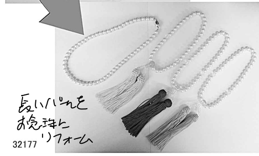
32177 長いパール ネックレス にリメイク