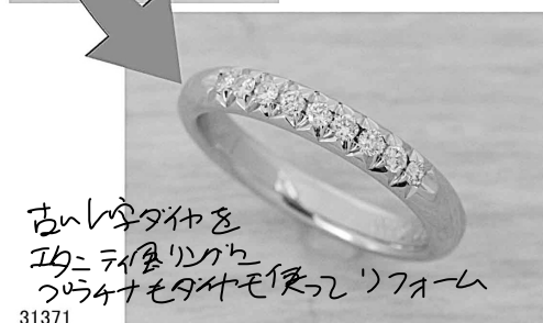
31371 古いダイヤを 2つに作り直して 3つに作り直してリメイク