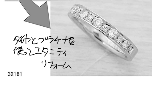
32161 ダイヤとつや出し 使ったダイヤ にリメイク