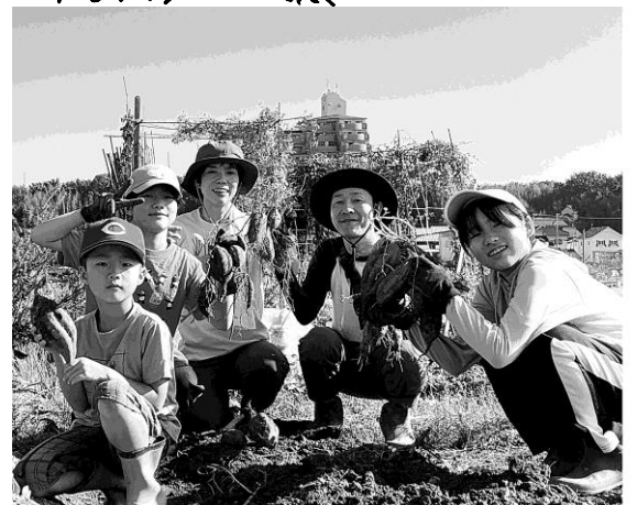
アコミちゃんの収穫