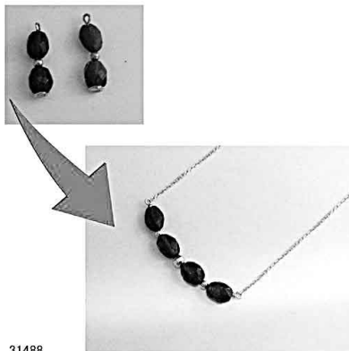
31488 イヤリングをフタネネックレスにリフォーム