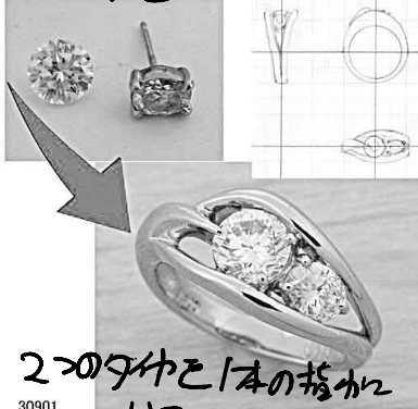
30901 2つの石を1本の指輪に リフォーム