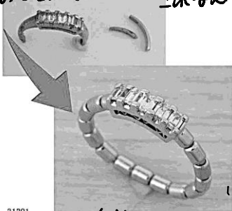
31201 思いつきの指輪をフタネに リフォーム