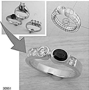
30951 3本の指輪を1本にリフォーム