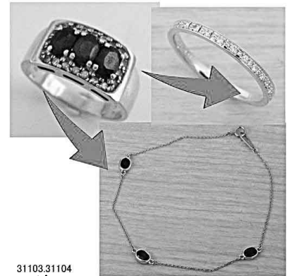
31103.31104 指輪が エタニタリングで フタネネックレス リフォーム