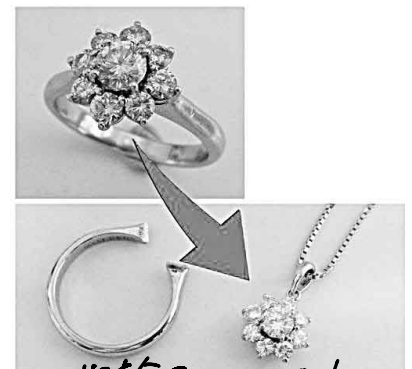
31267 指輪を10分石に4 リフォーム