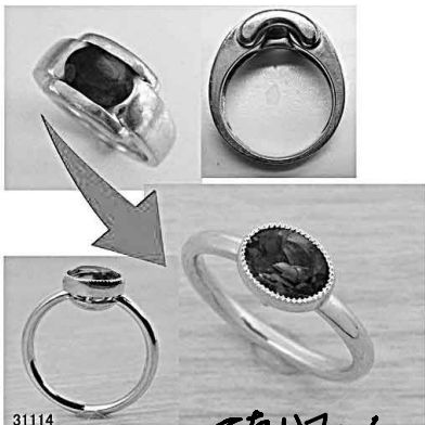
31114 高さに深さのある石をリフォーム ニハカブがたい!