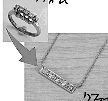
31186 ラファエを指輪をフタネネックレスに リフォーム