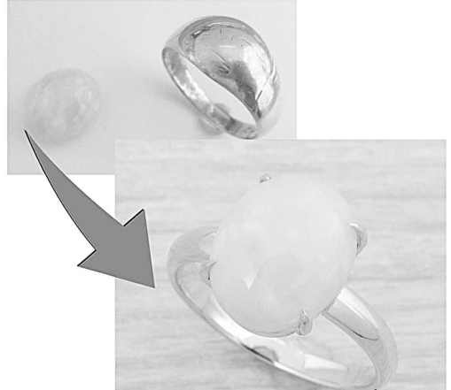
29878 オパールを手に持つ金の溶かし指輪