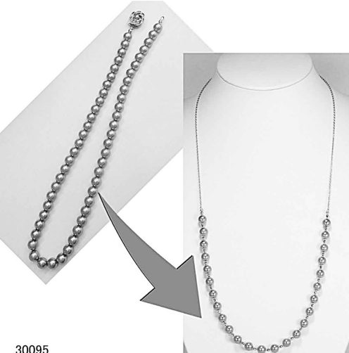
30095 お母様の思い出のペンダントをカシミアのリフォーム