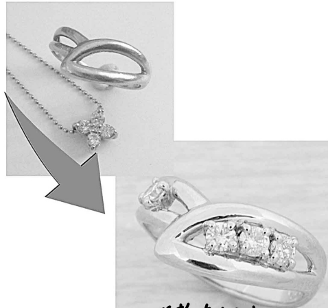
29916 お気に入りの指輪をトップリングにダイヤを入れて補強して。