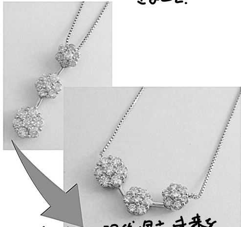
30109 大切な現代・過去・未来を横たえるペンダント