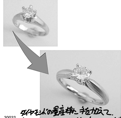
30032 ダイヤモンドの量産品に手を加えてオリジナルリングを作りました。