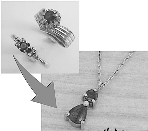
29920 思い出がいつかこの指輪を合わせたお母様のペンダント