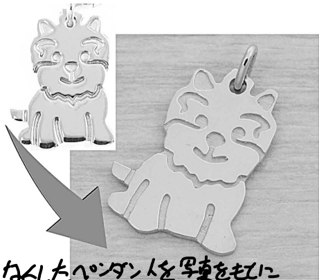
29830 ねんしたペンダントを写真を参考に作り直していただきました。