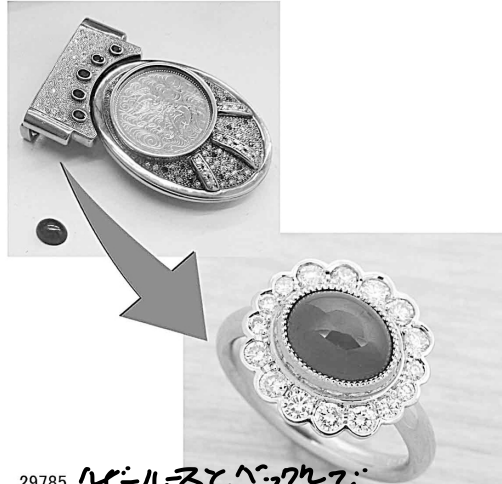
29785 ルビーとエメラルドのかわいい指輪をリフォームしていただきました。