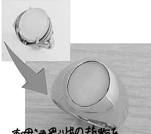
29796 お母さま思い出の指輪をいかに大切に作るようにリフォーム