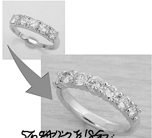
29869 5つのダイヤを18金にダイヤを足してエタニティリング