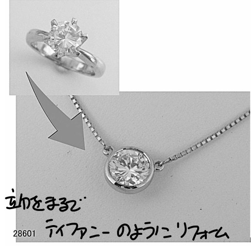
直金を ダイヤのよう 28601