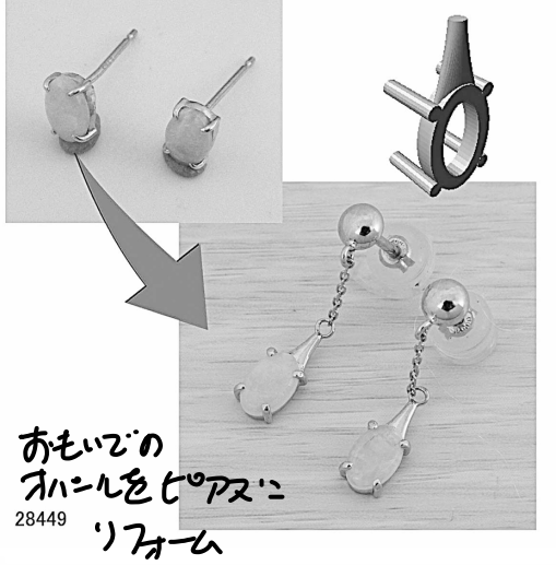
おもいで の 28449