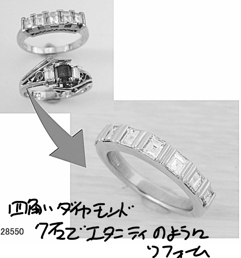
四角いダイヤ 7石でエッセイ 28550