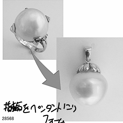
指輪をペンダントに リフォーム 28568