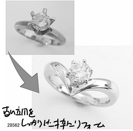
古い祖母 しかりは、持ち直し 28562