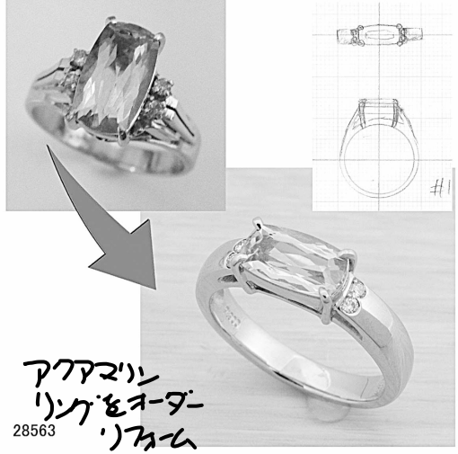
アマゾン リングをオーダー リフォーム 28563