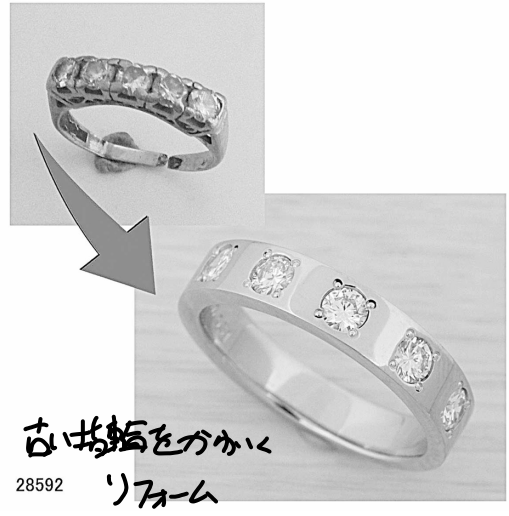
古い指輪をガク リフォーム 28592