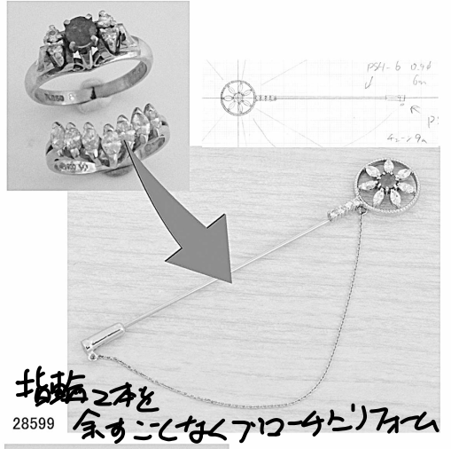
指輪を 余りこしたくアーク 28599