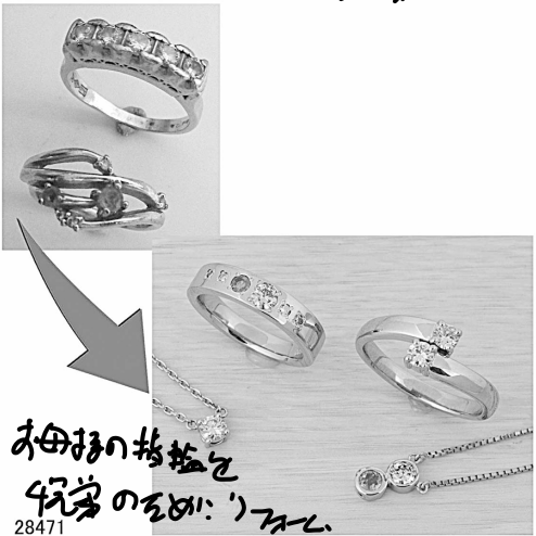
お母様の 4石 28471