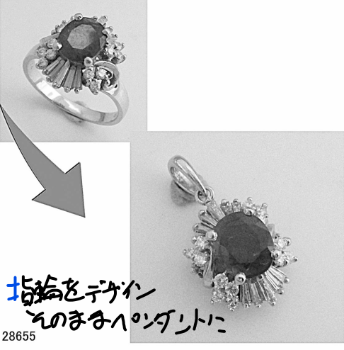
指輪をデザイン そのまゝペンダントに 28655