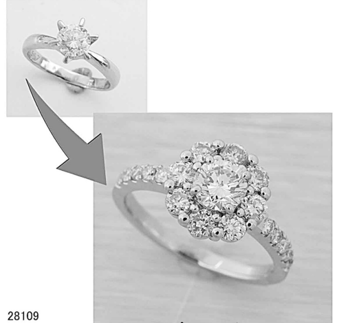
28109 婚約指輪をフルオーダーリフォームさせていただきます。