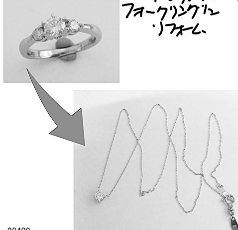
28408 婚約指輪をこくしんがれるデザインのリフォーム