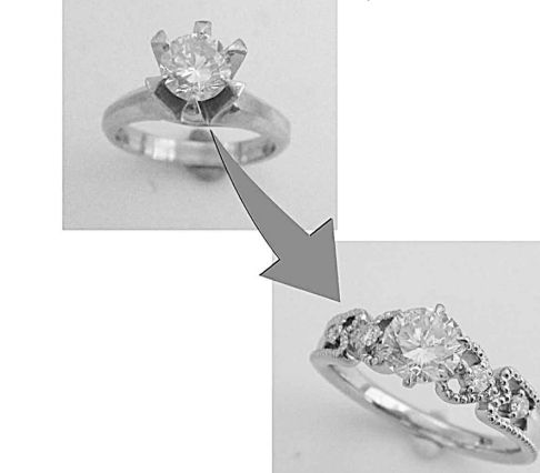
28416 直ぐお直しをかけたダイヤリングをリフォーム