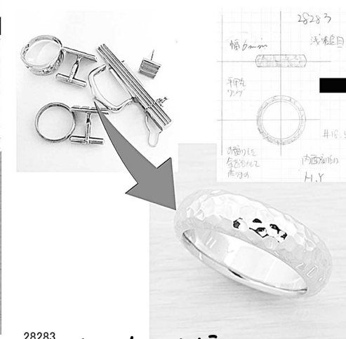
28283 お母様の遺品を溶かして指輪にリフォーム