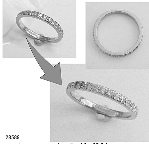
28589 ティファニーのティアニティリングをサイズ直ししお直しも大変であ