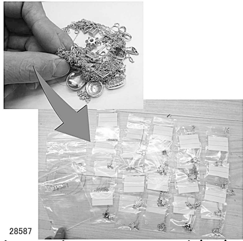
28587 ネットを絡み修理した本も11個はいかんやろ～