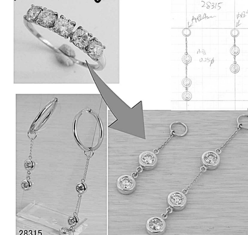
28315 5石ダイヤリングを楽しいデザインのリフォーム