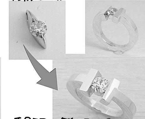
28226 お母さまのダイヤモチーフをリフォーム