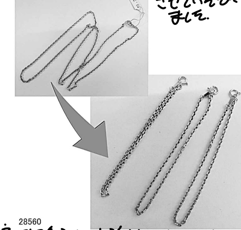
28560 ネットを3人のお嬢さんへリフォーム