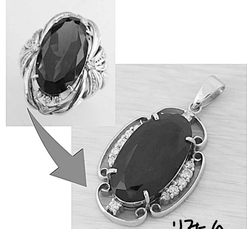
27997 リフォーム指輪として使いたいのデザイン