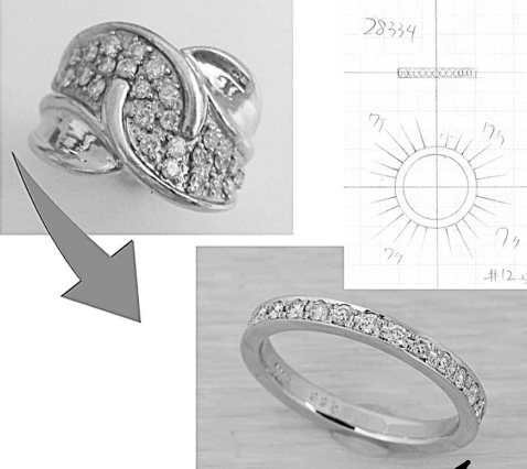
28334 使いたくないダイヤリングをフルオーダーリフォーム