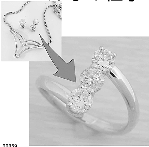
26859 3石のダイヤで1輪でかかいかい!!