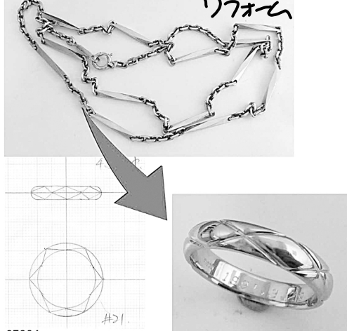
27034 ダイヤを溶かしてリフォーム