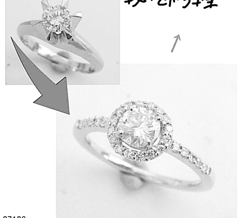
27126 お母さんのダイヤを結婚式に向けた合めせで大きめにリフォーム