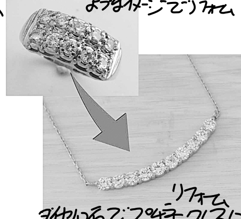
26858 ダイヤ10石でダイヤネックレスにリフォーム