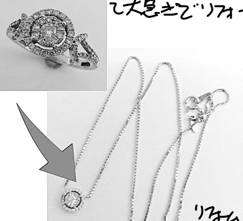
27070 指輪の石座をダイヤネックレスにリフォーム