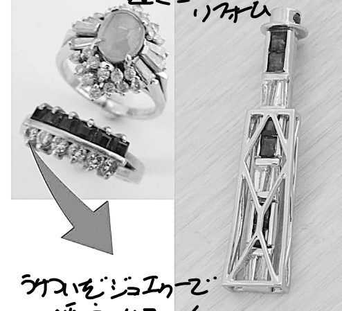
26816 ダイヤをジュエリーで煙突にリフォーム