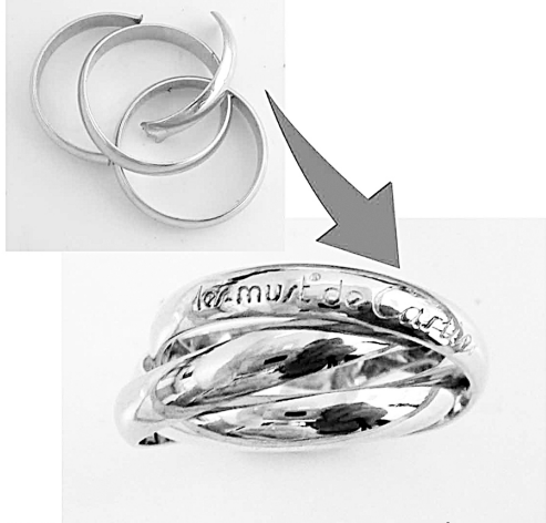
27137 板けなくなった指輪を切り指から板け直し修理