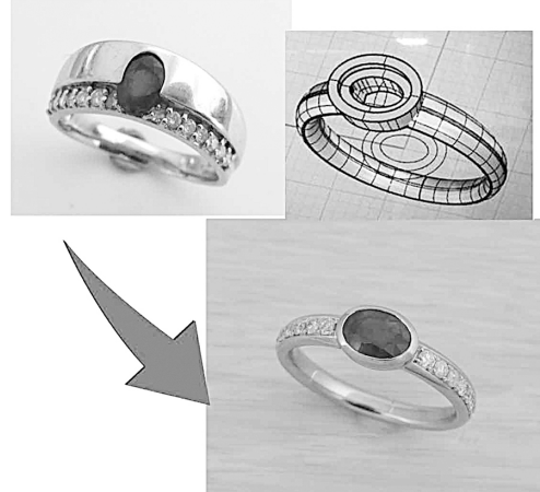
27085 1ヒビを換置品にして使いやすくリフォーム