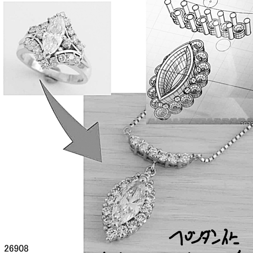
26908 10カラットのダイヤモントをあまざるリフォーム