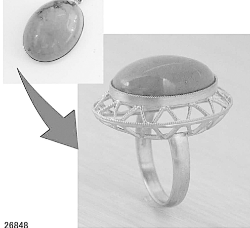
26848 トルコ石を地球に見え宇宙船のようイメージでリフォーム