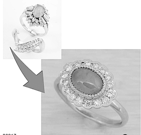
26817 キャリアを横あまをライカさんのようにリフォーム