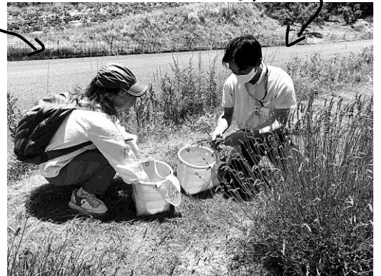
ラベンダーの収穫

の抽出を体験する機会がありました。エッセンシャルオイルというのは、植物の揮発性の香りの成分を云うそうです。この体験をしてきました。嫁は、〇〇の一つ覚えでラベンダーです。