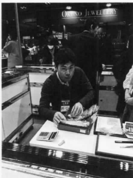
国際宝飾展で 丸タヤの 買った。 イトムから 一袋 数十枚入り をまとめて買って。 丸タヤの コワイ!!