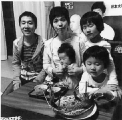
娘あゆみ 一家 おくい初め。