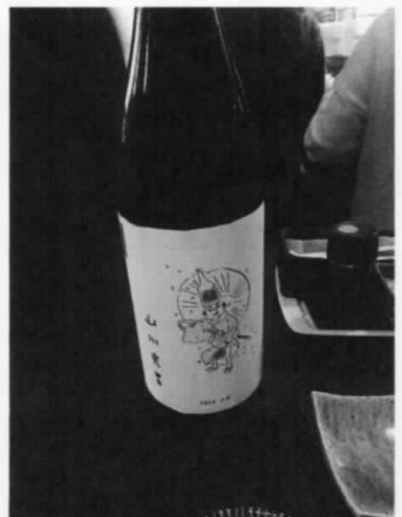
最近お土産に巻いた酒 山川光男 /