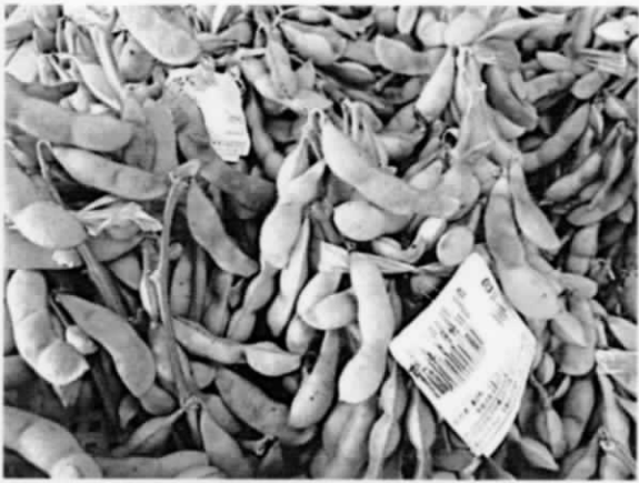
えんどうめ 実がふくらぶ

このところ、古い作家の歴史小説が読めるようになり、新田次郎の「武田信玄」、司馬遼太郎