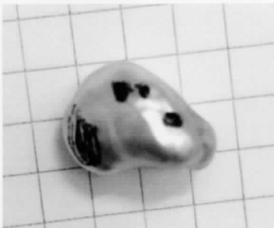
スマーティーの仔ら真珠