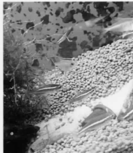
ヒラキの 熱帯魚 ネボナラ