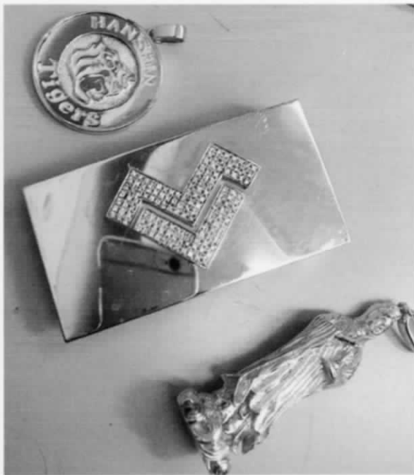
昔作られたタガースコン バックル 銀器は すべて18金製です。