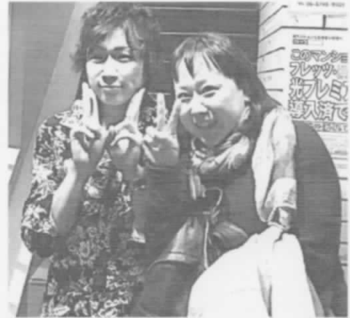
おたのしみ-サズキカズキ