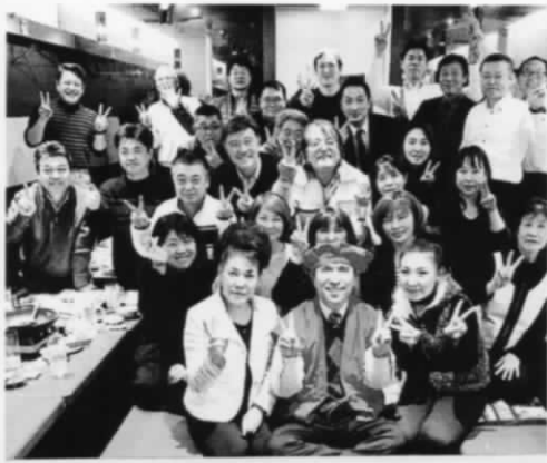
平成29年5月5日 白木屋 長瀬駅前店にて