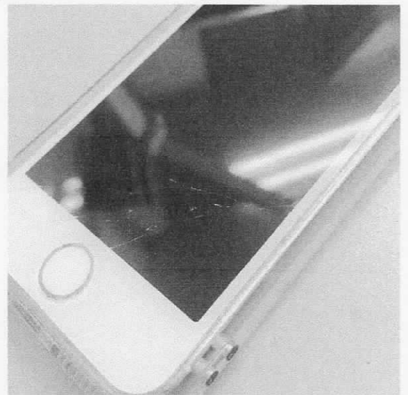
↑割れたおまのトミオちゃんのiPhone