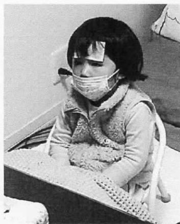
風邪防止マスクのトモちゃん かわいい〜