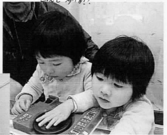
↑ トモカワ 2人分お揃いのトランプ ← お母さんお揃いの服。マコ