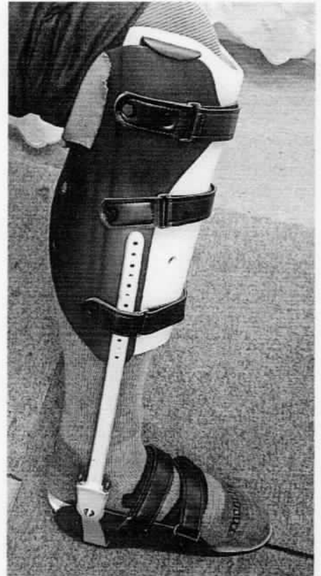
代 12万円の器具 オルターメイトでこんな感じ？